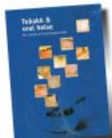
FIGUR 2. I de fyra nordiska länderna har man nyligen gett ut handböcker i rökavvänjning.

Av de tobaks- och snusavvänjningsprogram som initieras inom munhälsovården lyckas 3–30 procent [3]. Siffran är densamma inom den övriga hälsovården [6]. När det gäller vissa snusavvänjningsprogram har munhälsovården nått bättre resultat än övriga yrkesgrupper. Det beror främst på att man har kunnat visa förändringarna i munnen för snusarna.