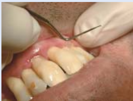
FIGUR 1. Ved å trykke på gingiva med lommedybdemålerens "bakside", kan man se om det blir et merke på gingiva som blir stående, dvs. inflammasjon.