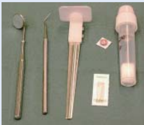
FIGUR 2. Hjelpemidler ved etterkontroller.

lommedybdet/festetap er nyttig i risikoområder for å registrere en progresjon av festetap. Det er dessuten nødvendig å gjøre en grundig eksaminasjon av furkasjoner og andre problemområder.