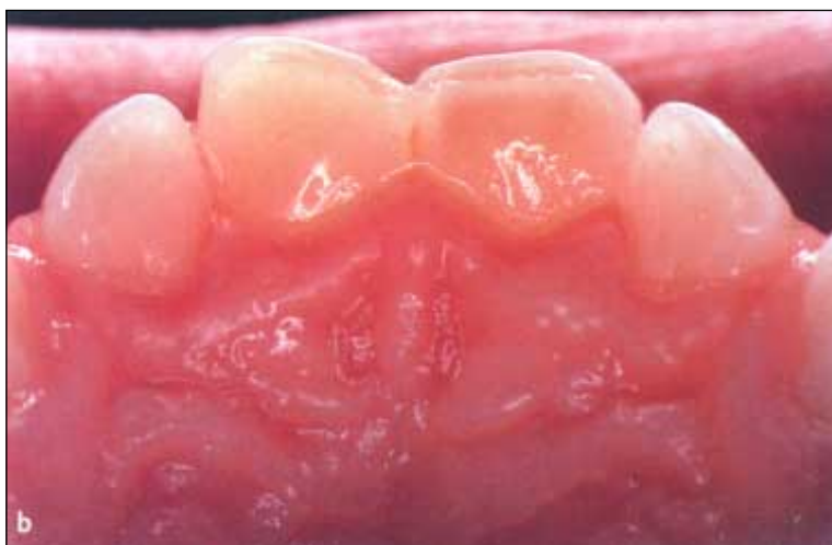
Figur 7. Misfarge som følge av lateral luksasjon av 51 og 61. a) Tre måneder etter skaden med henholdsvis gul og gråblå misfarge. b) Tre måneder senere (seks måneder etter skaden), 51 er fremdeles gulaktig misfarget, mens 61 har forandret farge fra gråblå til gulbrun.