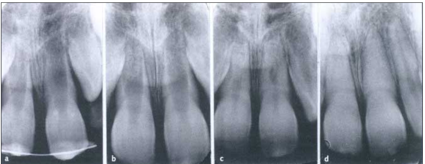
Fig 6. Vellykket replantasjon av 21 hos syv år gammel gutt. 21 replantert umiddelbart av guttens far. a) I løpet av fikseringsperioden. b) Normale pulpale og periodontale forhold fem uker etter skaden. c) Fortsatt rotutvikling og forsnevring av pulpakanaler 1 \frac{1}{2} år senere. d) Avsluttet rotutvikling, normale periodontale forhold og total obliterasjon av pulpakanaler 4 \frac{1}{2} år etter replantasjonen.