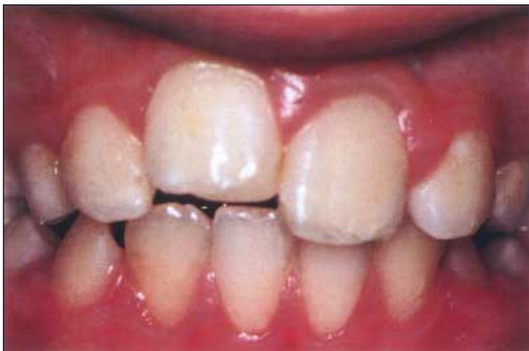
Figur 4. Infraposisjon av replantert 11 som følge av erstatningsresorpsjon (ankylose).