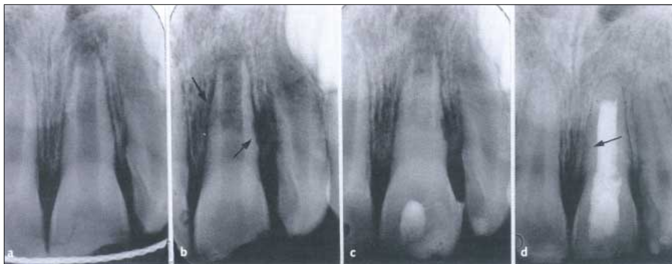
Figur 1. Ekstern inflammatorisk rotresorpsjon etter ekstrusjon av rotåpen 21. a) Reponering og fiksering utført i løpet av få timer. b) Diagnose av inflammatorisk rotresorpsjon mesialt og distalt (piler) 4 uker etter skaden. Radiolusens også i tilgrensende ben distalt. c) I løpet av langtidsbehandling med kalsiumhydroksidpasta. d) Ti år etter skaden. Vellykket endodontisk behandlingsresultat. Fullstendig reparasjon av resorpsjon distalt og delvis mesialt (pil).

lig misfarge kombinert med negativ sensitivitetsreaksjon har vært betraktet som en god indikasjon på nekrose. I en studie av lukserte og rotfrakturerte tenner er det rapportert at også en grålig misfarge kan forsvinne [7].