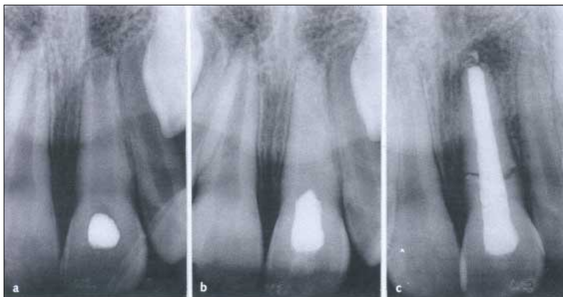
Figur 2. Spontan rotfraktur i rotåpen 21 som følge av pulpanekrose. a), b) I løpet av langtidsbehandling med kalsiumhydroksidpasta. c) Rotfraktur (spontan) observert ett år etter fullført endodontisk behandling.

Prognose: Periapikal tilheling (95 %) [9]. Behandlingsresultatene er derfor gode når de periapikale forhold vurderes isolert. En ung incisiv