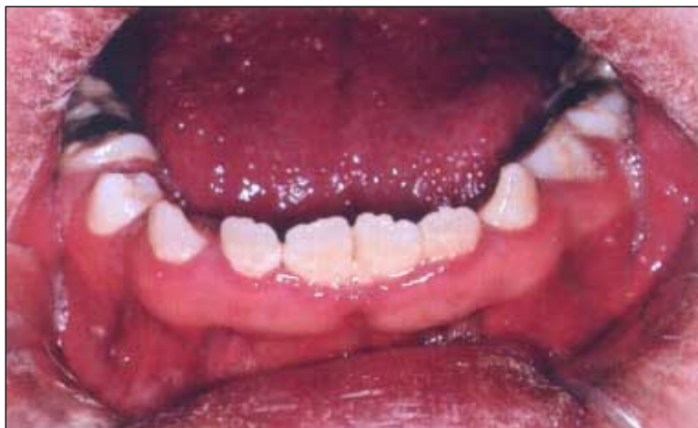
Figur 2. 18-årig pojke med Downs syndrom som har hjärtfel. Patienten uppvisar perifer cyanos och har uttalad gingivit.