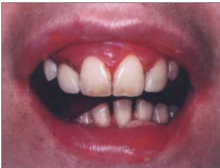
Figur 6. Patient med epidermolysis bullosa som har medfört reducerad gapförmåga när blåsor och sår förorsakat ärr i vävnaderna.

Ektodermal dysplasi är ett samlingsnamn på över 100 olika tillstånd som drabbar hår, hud, tänder, naglar eller andra typer av ektodermal vävnad. I vissa fall påverkas patientens svettproduktion negativt. Många av tillstånden är ärftliga och de flesta patienter med diagnosen ektodermal dysplasi har tandanomalier i form av tapptänder och multipla aplasier. I de allvarligaste fallen, där patienten saknar samtliga tänder i ena eller båda käkarna, kan det bli aktuellt med implantatbehandling redan i tidig skolålder [29].