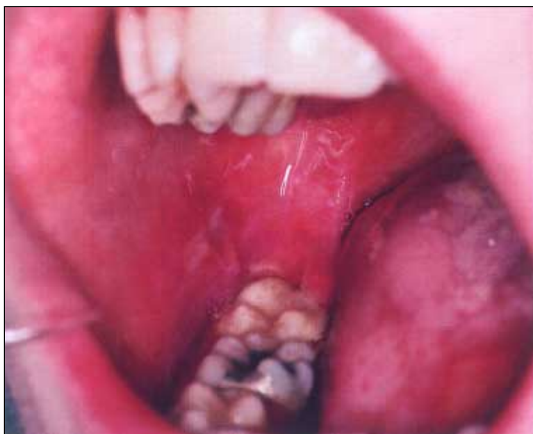
Figur 3. Mukositis hos patient som behandlats med cytostatika i kombination med strålbehandling.

måste behandlas kirurgiskt, därefter noggrann plackkontroll.