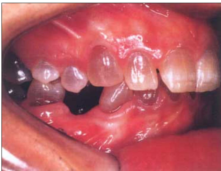
Figur 7. Patient med osteogenesis imperfecta som har medfört utveckling av dentinogenesis imperfecta (förekommer hos en tredjedel av patienterna).