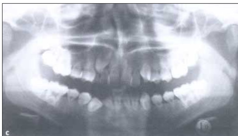
Figur 4. 5-årig pojke med akut leukemi som behandlats med 10 Gy helkroppsbestrålning i samband med benmärgstransplantation. a) OPG före behandling vid 5 års ålder. b) OPG vid 8 års ålder, tre år efter strålbehandling. Notera slutning av apices på 36 och 46. c) OPG vid 14 års ålder, nio år efter strålbehandling. Rotutvecklingen är kraftigt störd på samtliga permanenta tänder.

i det subgingivala plackett än hos friska kontrollbarn [17]. Då cirka var tredje tonåring i åldern 10–19 år visade tecken på alveolär benförlust främst kring underkåakens framtänder [18] är det betydelsefullt att barn med Downs syndrom tidigt involveras i ett vårdprogram riktat mot gingivit