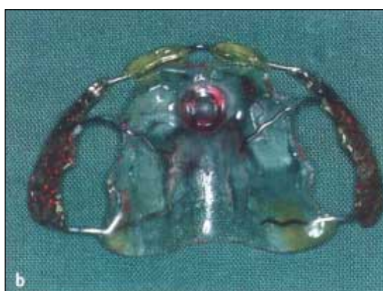
Figur 1. Gomplatta för stimulering av tunga och läppar. a) gomplatta för barn vid 6 månaders ålder. b) gomplatta för barn med primära tänder.

ungdomar med diabetes har ökad förekomst av alveolär bendestruktion jämfört med friska individer. När individuella tandtytor studerats har emellertid en ökad gingivitförekomst hos diabetesbarn iakttagits [7]. Hos äldre har en ökad förekomst av parodontal sjukdom rapporterats, speciellt hos patienter med en eller flera andra organskomplikationer, som retinopati, njursjukdom eller högt blodtryck.