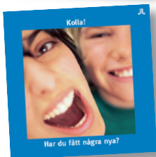
Figur 3. Foldrar anpassade till riskåldrar som Stockholms läns landsting tagit fram. Foldrarna används av folk-tandvården i Stockholms och Uppsala län.

har man tagit fram ett situationsanpassat informationsmaterial, de får fluorsköljningar i skolan varje vecka samt fluorlackning av nyrupterade tänder. Genom att ge samma information vid flera tillfällen (på BVC, vid besök på kliniken och i skolan) kan man säkerställa att riskgrupper i socioekonomiskt utsatta områden nås av det grundläggande tandhälsobudskapet. Beräkningar visar att cirka 25 procent av det totala antalet barn i Stockholm bor i riskområden och de kommer att omfattas av programmet. Revisionsintervallet mellan två undersökningar är 24 månader för alla barn och ungdomar, men med individuell riskbedömning som grund kan revisionsintervallet kortas.