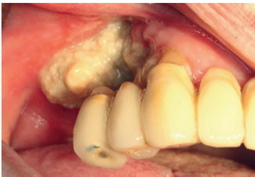
Figur III. Käkbensnekros (BRONJ) efter peroral behandling med bisfosfonater i över tio år (alendronat).