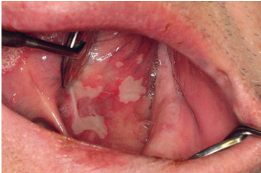
Figur II. Deskvamativ stomatit i munbotten orsakad av ACE-hämmare (enalapril).