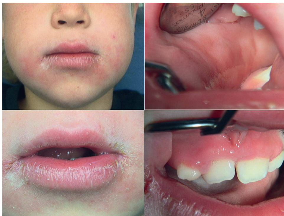
Figur 1. 8-årig pojke som sedan flera år har haft astmatiska besvär. Sedan två månader har han även besvär i form av peri- och intraorala svullnader. Extraoralt noterades svullnad av kinderna och underläppen samt munvinkelragader. Intraoralt uppvisade patienten bilateralt en ödematös svullnad i kind-slemhinnan med tendens till lobulering och fissurering samt gingivala erytem och hyperplasier. Biopsier togs från kindslemhinna, läpp och gingiva och i samtliga lokalisationer noterades epiteloidcellig granulomatos. Patienten erhöll diagnosen OFG och remitterades till barnmedicinsk klinik för fortsatt utredning.

»Biopsin är värdefull vid diagnostik av OFG.«